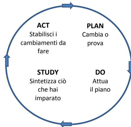
Figura 6.1 Il ciclo PDSA

I cambiamenti nei processi spesso generano progetti di audit , in aggiunta alla revisione di documenti quali i piani strategici. 3